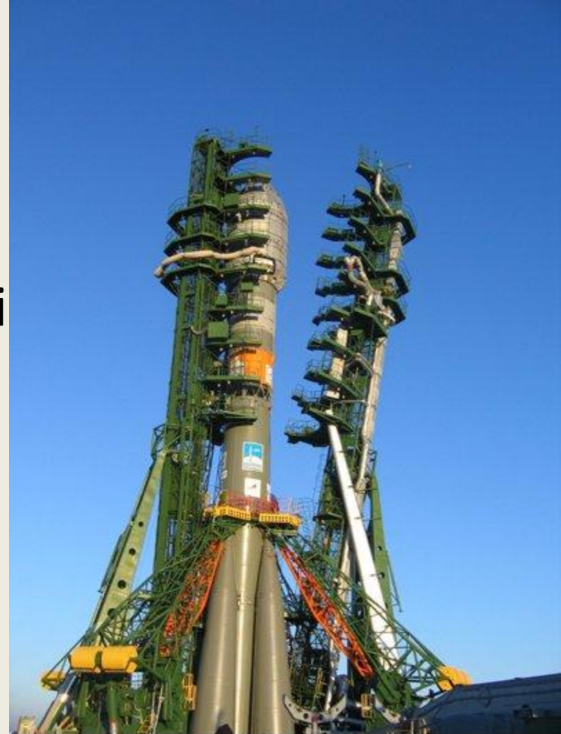
RADARSAT-2 launch vehicle (Soyuz) at the launch pad.